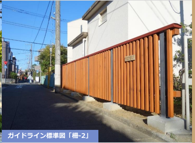
ガイドライン標準図「柵-2」