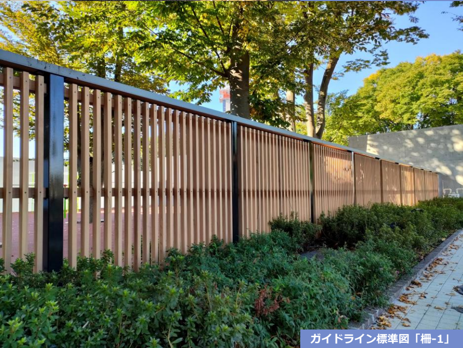
ガイドライン標準図「柵-1」