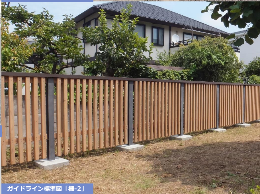
ガイドライン標準図「柵-2」