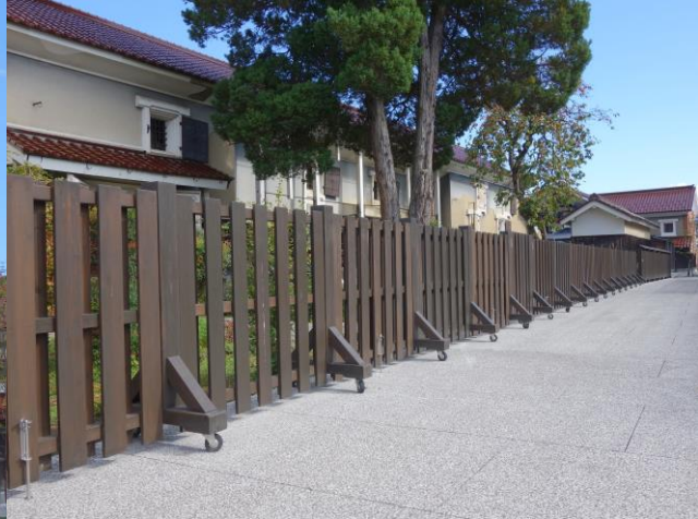
三十八間蔵 蔵庭（福島県）