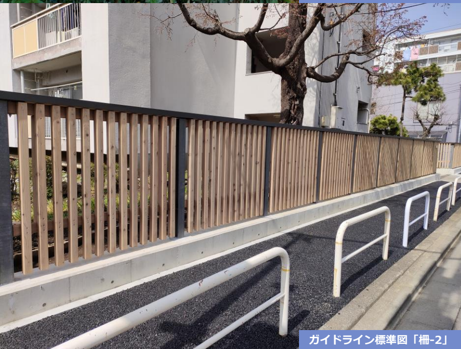
ガイドライン標準図「柵-2」