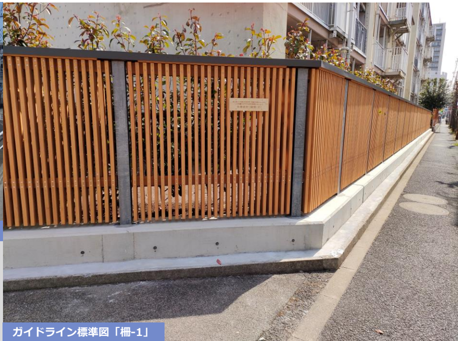
ガイドライン標準図「柵-1」