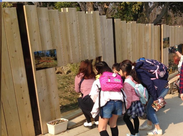
埼玉県こども動物自然公園（埼玉県）