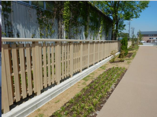
上：平城宮跡歴史公園（奈良県）