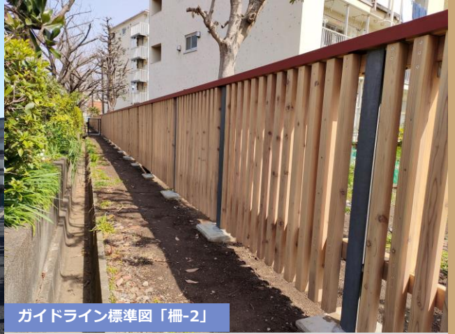
ガイドライン標準図「柵-2」