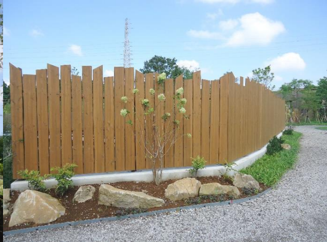
よこはま動物園ズーラシア（神奈川県）