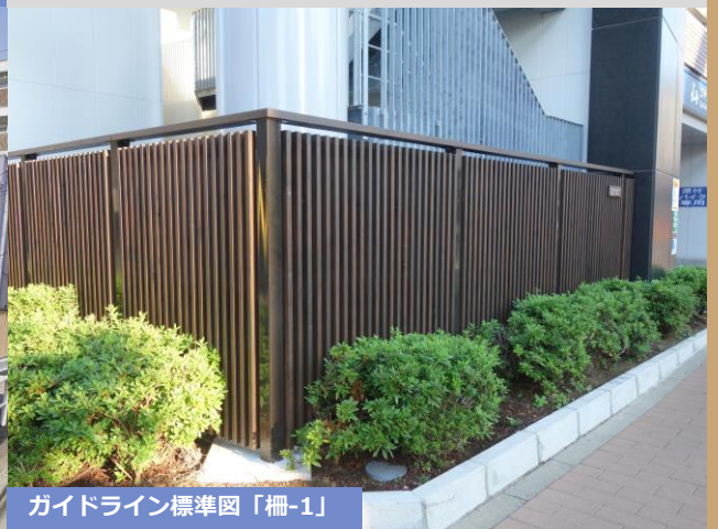
ガイドライン標準図「柵-1」