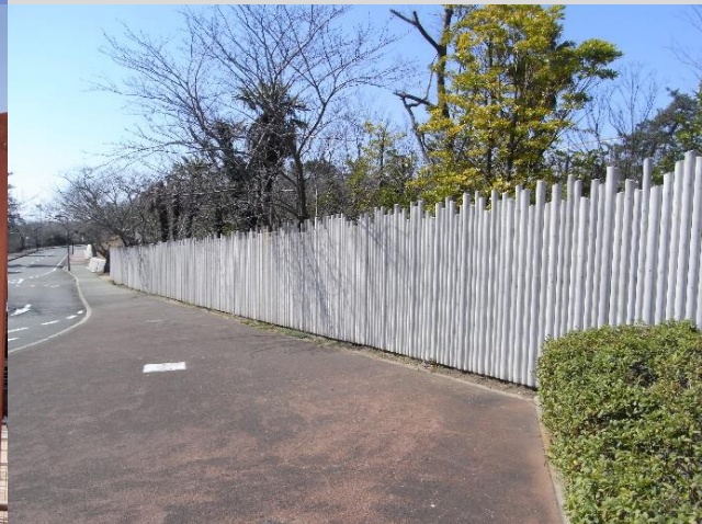
上：ときわ公園動物園（山口県）