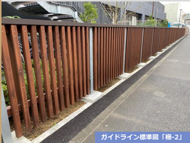
ガイドライン標準図「柵-2」