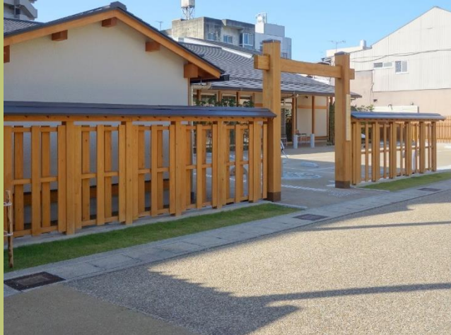
上：中山道加納宿まちづくり交流センター (岐阜県)