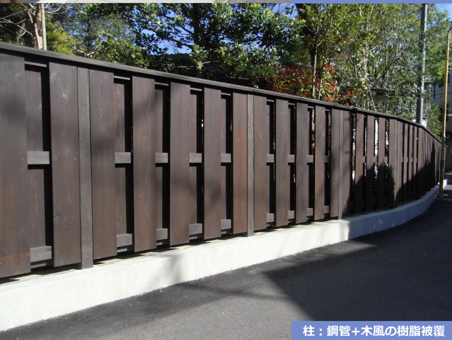
柱：鋼管+木風の樹脂被覆