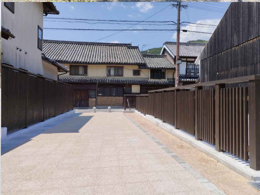
右：たつの市営下川原駐車場 (兵庫県)

歴史まちづくり法に基づく整備など、日本全国で和のまちづくりが進められています。ガイエンスでは 全国4箇所に工場があり、各地地場産材を使った木塀 の納入対応が可能です。