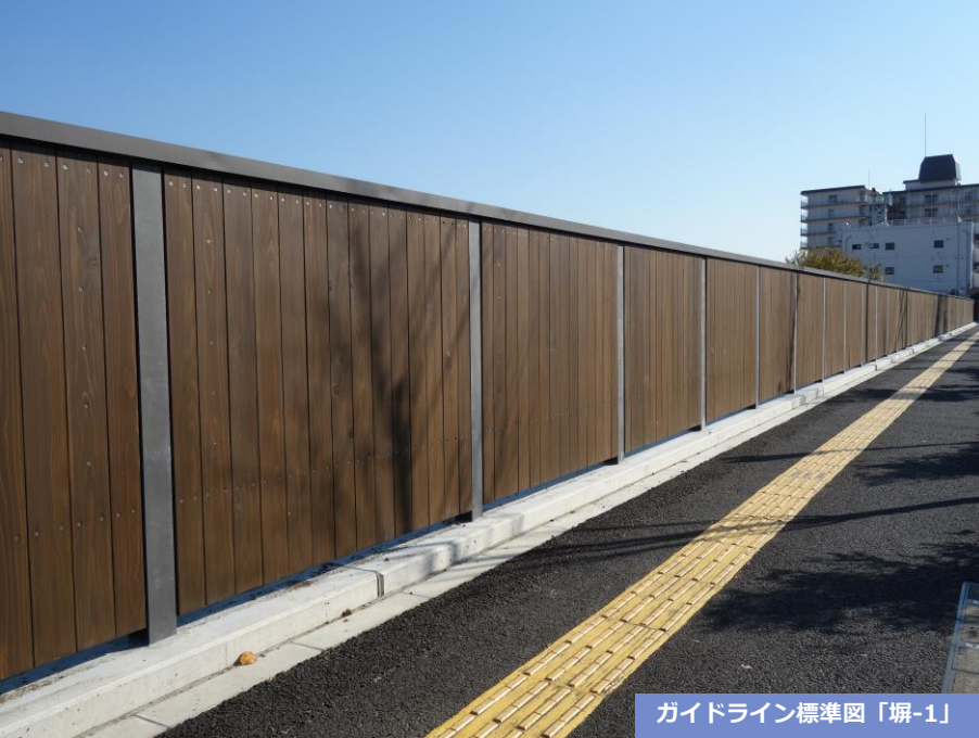
ガイドライン標準図「柵-1」