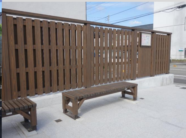
上：灘町ポケットパーク（愛媛県）