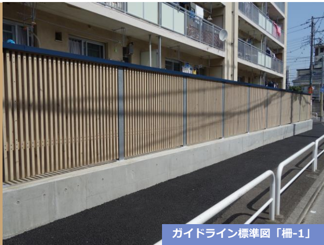
ガイドライン標準図「柵-1」