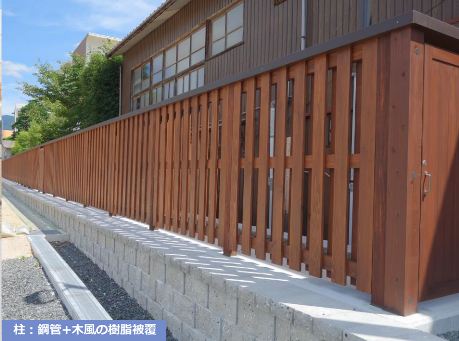
柱：鋼管+木風の樹脂被覆