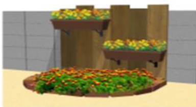
フラワースタンド