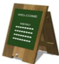
ウェルカムサイン