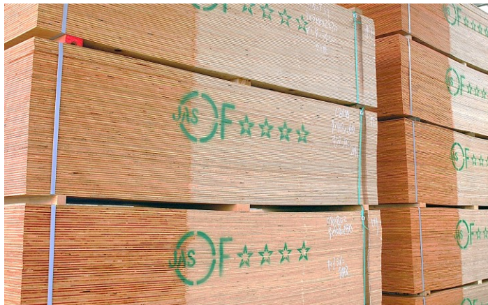
■合板への浸漬表面処理 (サンプルザーPW96)