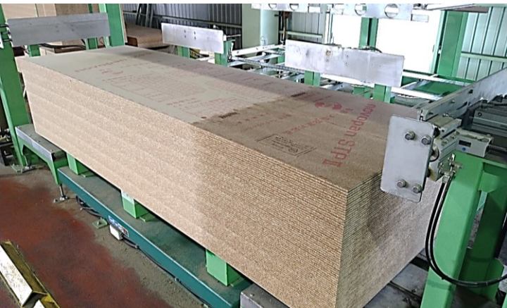
■パーティクルボードへの乾式表面処理 (サンプルザーOPエースST)