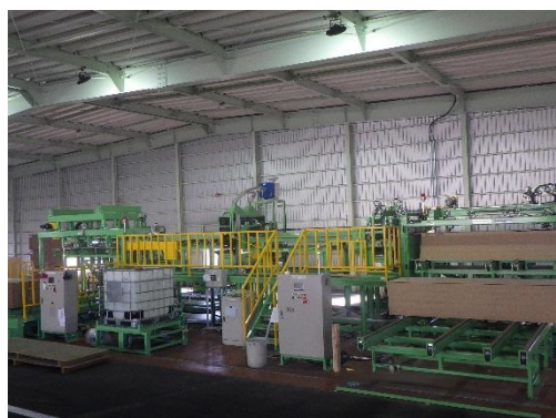
■面材の工場処理設備