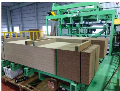
■パーティクルボードへの 乾式表面処理